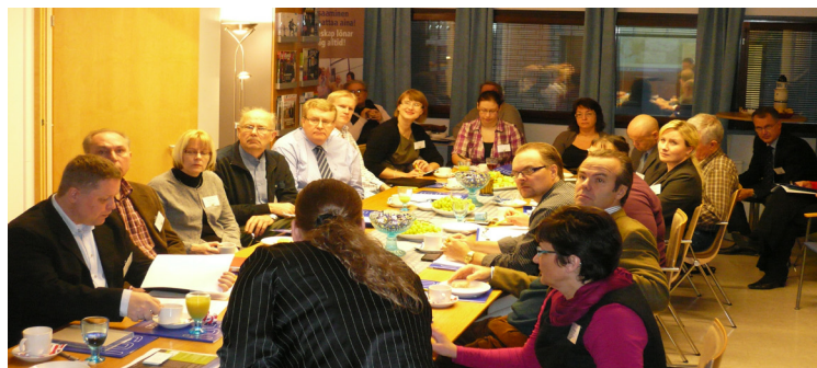
Kuvassa Venäjä-aamukahvivilaisuuden osallistujia.

Novagon Lohjan toimitiloissa järjestettiin yhdessä KO-KO-RUSSIA -verkoston kanssa Venäjä-aamukahvivilaisuus, jossa oli mukana alueen yrityksiä ja kokeneita Venäjä -asiantuntijoita. Tilaisuudessa keskusteltiin mm. miten Venäjän markkinoille on mahdollisuus päästä. Venäjä nähdään alueella tärkeänä kasvavana markkina-alueena esim. hyvinvointimatkailun näkökulmasta.