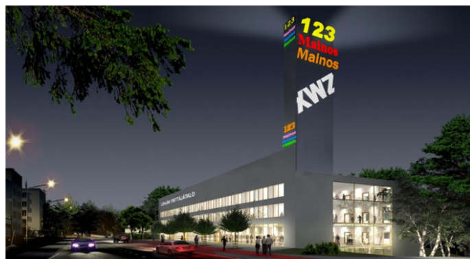
Kuvissa virtuaalinen näkemys Lohjan Yrittäjätalosta.

Rakennuttajana toimii YIT Rakennus Oy, rahoittajana ja kiinteistön omistajana Keskinäinen Eläkevakuutusyhtiö Etera.